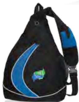
HAVRESAC ASSORTI KN4951. CONSULTEZ LA PAGE 107